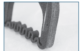
Høj teknisk kvalitet