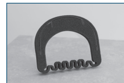
Lukket i toppen for at nedbringe smitterisikoen mest muligt.